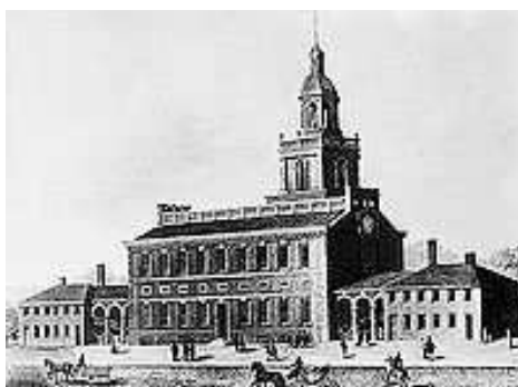
Nhà Độc Lập năm 1770.