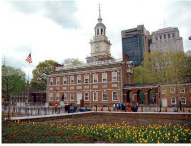
Nhà Tuyên Bố Độc Lập