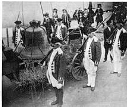
Hình ảnh cuộc diễu hành năm 1908 để kỷ niệm việc di chuyển chuông từ Philadelphia tới Allentown năm 1777.

Cũng có thêm một câu chuyện khá lý thú về chiếc chuông này là vào ngày 11 tháng 9 năm 1777. Trước khi quân Anh tấn công chiếm Philadelphia, thành phố đã phải dùng tất cả chuông để nấu đúc thành súng đạn. Để tránh chiếc chuông “Tự Do” bị cùng chung số phận với những chiếc chuông khác, người ta đã di chuyển nó đi “tỵ nạn” tới thành phố Allentown . Chuông được đem trở lại vào tháng 6 năm 1778 sau khi quân Anh rút khỏi thành phố Philadelphia.