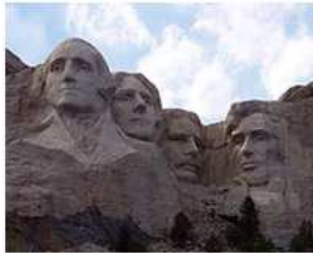
Tượng 4 vị tổng thống Mỹ: George Washington, Thomas Jefferson, Theodore Roosevelt, và Abraham Lincoln trên núi Rushmore (SD)

Thomas Jefferson là một người thông minh và lịch thiệp. Ông viết giỏi, lời văn của ông bao giờ cũng được cân nhắc sao cho những điều ông viết ra phải được giản dị, rõ ràng và chính xác nhất. Và trong quá khứ ông đã từng viết một số văn kiện quan trọng cho Quốc hội. Trong trường hợp soạn thảo “ Bản tuyên ngôn độc lập ”, ông đã mất hai ngày trời để hoàn tất. Bản này được chia ra làm 3 phần.