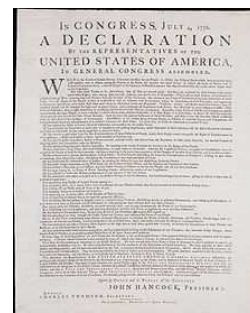
Bản Tuyên Ngôn Độc Lập

Những khu lịch sử chính mà du khách thường lui tới nhiều nhất phải kể đến là: