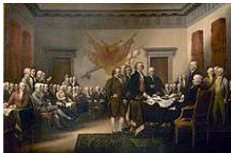
Thảo luận tại Quốc hội