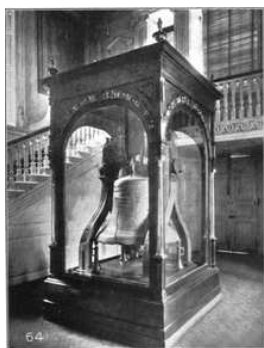
Chuông được đặt trong Nhà Độc Lập

Năm 2003 người ta xây cho nó một căn nhà riêng biệt rộng rãi và khang trang hơn trước được gọi là “ Trung tâm Chuông Tự do ” (Liberty Bell Center) như ta thấy hiện nay trong Quảng trường này. Chuông có chu vi 12 feet (3,7 mét), nặng 2.080 lb (900kg).