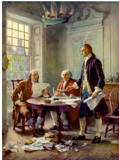
Dự thảo Bản Tuyên Ngôn Độc Lập