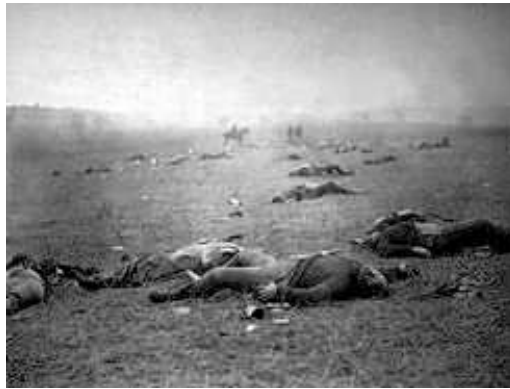
Chiến trường Gettysburg

Ngay từ đầu thế kỷ thứ 17, những trại chủ thuộc miền Nam Hoa Kỳ đã dùng người nô lệ da đen đưa từ Phi Châu sang để làm công việc đồng áng nặng nhọc hay giúp việc trong nhà. Những công việc này không đòi hỏi một sự hiểu biết chuyên môn nào mà chỉ thuần túy là lao động chân tay. Dần dần, sự phát triển nông nghiệp của miền Nam phải phụ thuộc rất nhiều vào thành phần nô lệ ấy.