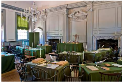
Phòng họp Quốc hội