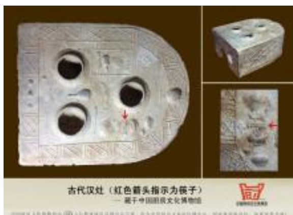
Hình bếp thời Hán với khả năng đã dùng đũa

1.4 《韓非子·喻志》中古箸稱櫡 《Hàn Phi tử. Dụ chí》 trung cổ khoái xưng giáp - trích từ trang mạng bách khoa TQ https://zh.wikipedia.org/wiki/%E7%AD%B7%E5%AD%90 ... Trong Hàn Phi Tử, Dụ Lão cũng có câu 昔者紂為象箸而箕子怖 tích giả Trụ vi tượng trợ/trứ , nhi Ki Tử phó - tạm dịch/NCT "thời xưa vua Trụ dùng ngà voi làm đũa (trợ), Ki Tử sợ hãi". Truyền thuyết này cho thấy đũa bằng ngà voi đã hiện diện từ thời nhà Thương (1154 TCN – 1123 TCN) hay khoảng hơn 3000 năm trước, tuy nhiên cần nhiều bằng chứng khách quan như từ khảo cổ để thêm chắc chắn. Một số tài liệu TQ thường trích câu này để cho rằng người Hán (TQ) đã phát minh ra chiếc đũa. Hình dưới trích từ trang mạng bách khoa TQ https://baike.baidu.com/item/%E7%AD%B7%E5%AD%90/249194