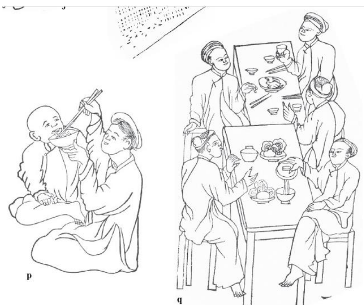
C. Hình ảnh bữa thời bé cho đến lớn

B, C trích từ các tranh vẽ sưu tầm bởi Henri Oger (1908-1909) "Technique du peuple annamite" - một công trình nghiên cứu văn minh vật chất (nghệ nhân Việt vẽ/viết chữ Nôm).