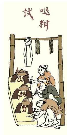
B. Thối cơm thi (chữ Nôm 13 )