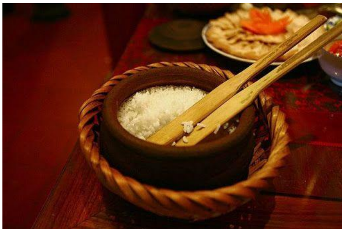
A. Đũa cả