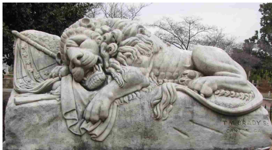
Tượng sư tử. Atlanta, Georgia (USA)